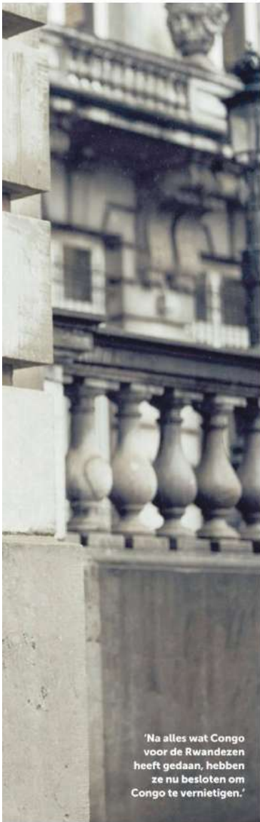
'Na alles wat Congo voor de Rwandezers heeft gedaan, hebben ze nu bestolen om Congo te vernietigen.'

"De problemen die we op dit eigenste moment ondervinden zijn begonnen toen Laurent-Désiré Kabila in 1997 met de Rwandezers aan zijn zijde Kinshasa veroverde. Hij kende hen mijnconcessies toe, maar zodra hij aan de macht was, werd hij een echte patriot. Al de bezittingen moesten terug naar Congo."